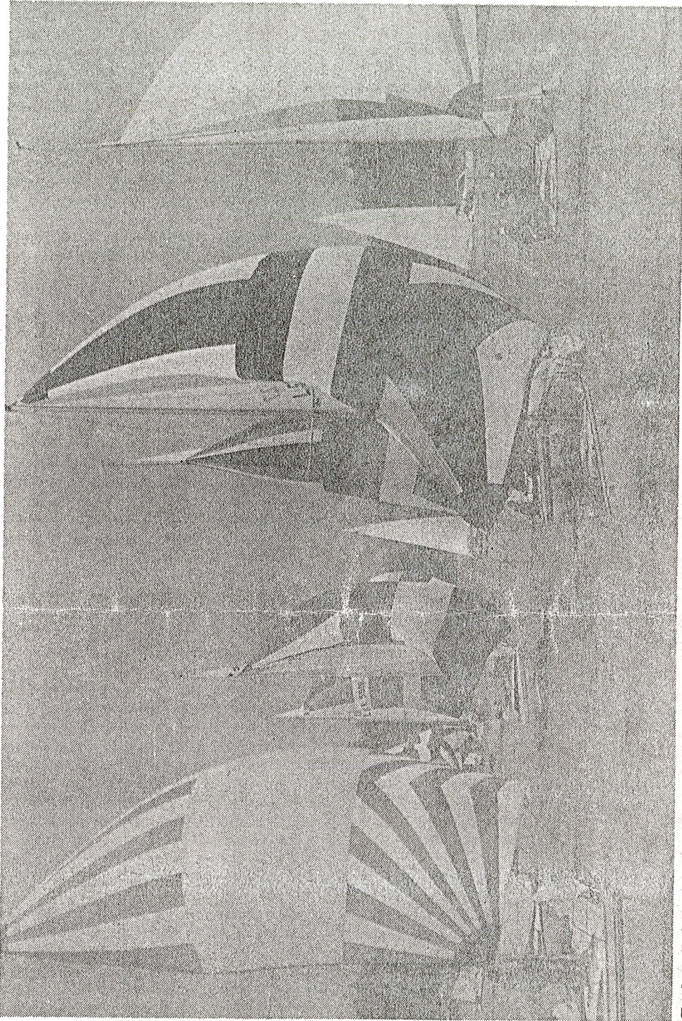
Tuulta riitti purjehtijoille. Myös sade ja ukkonen olivat veneilijöiden vieraina.

MAAILMIIN ON TUO-tus keskustella lo-asta sekä komp-päättäjien etiä miesteri kanssa ensi viikolla tehtä-puolista päätöstä. taiseksi suositel-että lomamatkoja Afrikkaan ei te-kerroo Paronen. Mahdollisiin ki-totomiin Paronen tanut kantaa. mukaan ”Iome suuruusluokka e-iso”. Samalla hän tei asiasta synt-koheua. Puolustusministeri antoi runsas viik-ten Paroselle vapa-det päättää suoma-lomailusta Etelä-kassa. Ministeriön selle lähettämässä-jeessä todettiin k-kin, että matkust-Etelä-Afrikkaan välttää. Myös ulko-teriö on aiemmin nut saman kannan.